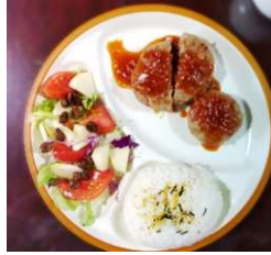
ハンバーグライス

わが事業所自慢の ”ノーコイン&ワン プレートランチ”!(^^)! すべてが手作り、 しかも無料! 野菜の多くは自給 しています。