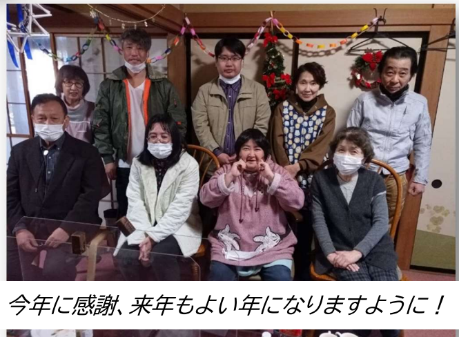
今年に感謝、来年もよい年になりますように!