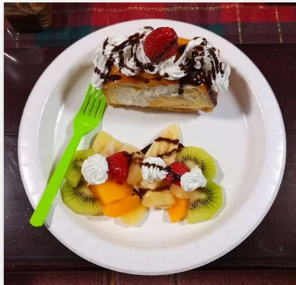
ブッシュ・ド・ノエル?