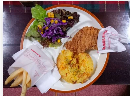
皆が大好きなモスチキンも♪