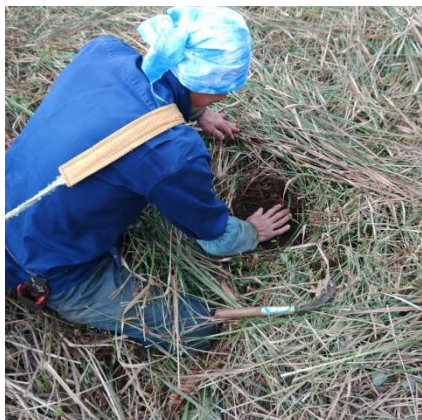
種まきや定植はやはりこんな感じ