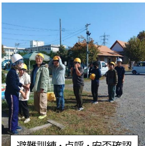
避難訓練・点呼・安否確認

自然災害が多発し、南海トラフ巨大地震の発生確率が今後30年以内に60～90%程度以上と言われる中、総合防災訓練によって、利用者の生命・財産の安全確保を図るとともに、施設職員及び利用者の防災意識を高めます。