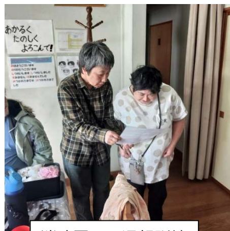
消防署への通報訓練

自然災害が多発し、南海トラフ巨大地震の発生確率が今後30年以内に60～90%程度以上と言われる中、総合防災訓練によって、利用者の生命・財産の安全確保を図るとともに、施設職員及び利用者の防災意識を高めます。