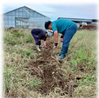
おでん大根種まき